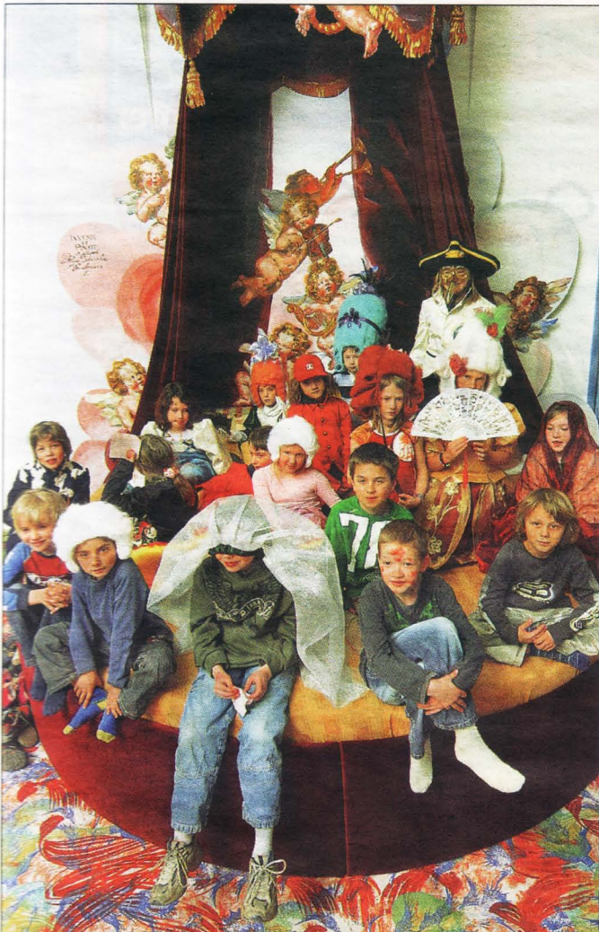
„WUNDERKIND Wolferl“: Mit W. A. Mozart im großen Himmelbett!

Hei, das war ein Spaß, als gestern die große Mitmach-Ausstellung dieses „Mozart-Jahres“ im Wiener ZOOM-Kindermuseum im MuseumsQuartier eröffnet worden ist. Denn da können jetzt alle Kinder zwischen 6 und 12 Jahren ausprobieren, wie der kleine Wolferl wirklich gelebt hat. Wie er gereist ist, was er gegessen und wie oft er sich gewaschen hat! Bis 30. Juni.